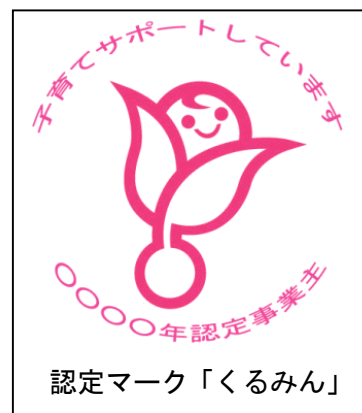
認定マーク「くるみん」